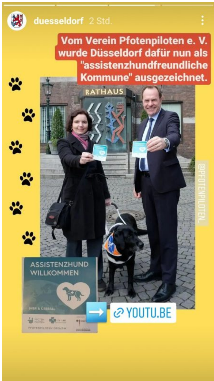
Eine Instagram-Story von @duesseldorf mit Bildern und dem Text: "Vom Verein Pfotenpiloten e.V. wurde Düsseldorf dafür nun als 'assistenzhundfreundliche Kommune' ausgezeichnet".