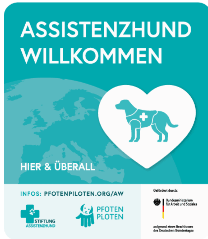
Assistenzhund Willkommen Aufkleber von Pfotenpiloten